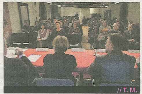
// T. M.