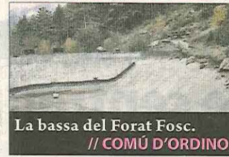
La bassa del Forat Fosc. // COMÚ D'ORDINO